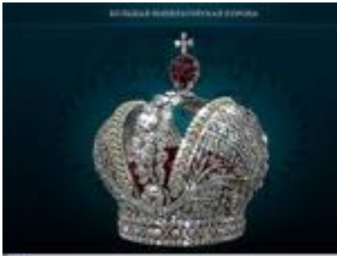
Большая императорская корона

На этот раз нас ждало не менее увлекательное путешествие в Москву. Началось оно с мира Кремлевских сокровищ — выставки «Алмазный фонд» . Это уникальная коллекция редких драгоценных и благородных камней, а также шедевров ювелирного искусства. 11 декабря 1719 года Петром I был подписан указ, который положил начало формированию коллекции коронных ценностей Российского государства. Мы познакомились с уникальными экспонатами в исторической части собрания, где покоятся коронные бриллианты русских самодержцев. Трудно описать все великолепие, которое предстало перед нами. Это и императорский скипетр, который украшает знаменитый алмаз «Орлов» ( 189,62 карат ), и держава Екатерины II с бриллиантовыми поясками и бриллиантовым крестом, и Большая императорская корона, буквально усыпанная бриллиантами ( всего их 5 тыс.! ). В основной части выставки Алмазного фонда находится коллекция российских орденов, цепи, украшенные драгоценными камнями, коллекция самоцветов. Здесь же мы увидели и работы ювелиров XX века. Алмазный фонд поразил наше воображение богатством родного края, мастерством русских умельцев. Наше путешествие продолжалось. Мы посетили музей Чарльза Дарвина . У входа в музей