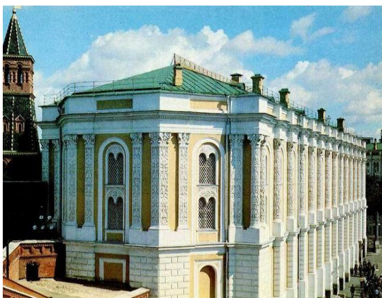
Оружейная палата Московского Кремля