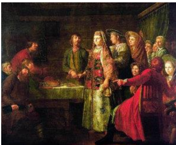
Шибанов Михаил. "Празднество свадебного договора". 1777. Третьяковская галерея. Москва.

На Руси праздник Покрова Пресвятой Владычицы нашей Богородицы и Приснодевы Марии называли Покров день, а еще: Первое зазимье, Свадебник, Третья Пречистая, Засидки, Обсичане, День Романа Сладкопевца, Покров-Батюшка.