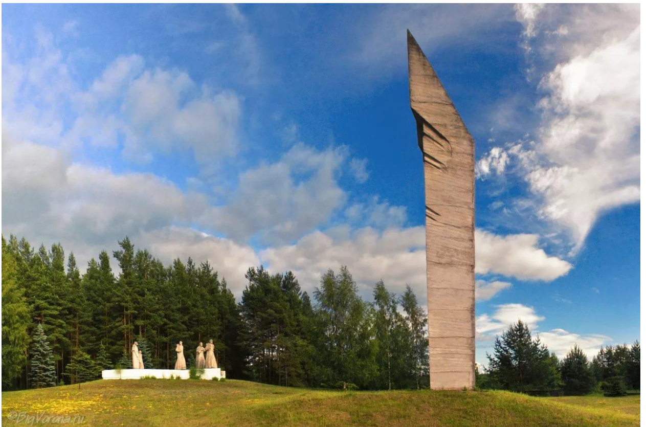
Обелиск Славы – мемориал