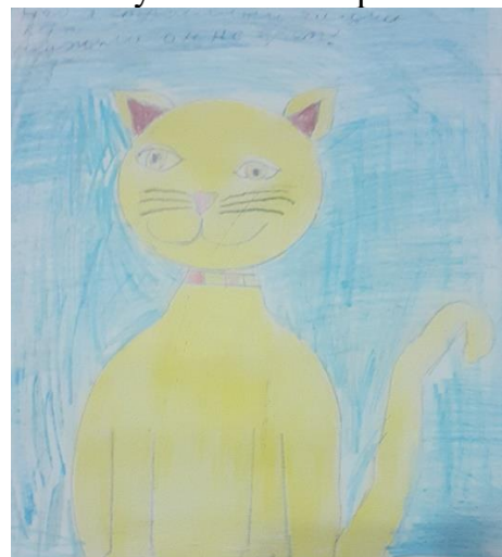
Назарова Дарья, 1в

Я узнал от попугая, что зовут меня не Зая, что я страшный хищный кот... Неужели он не врёт?