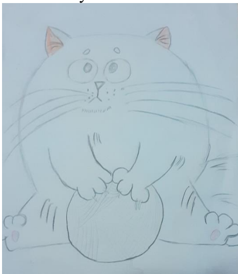
Королёва Ксения, 1в

Очень грустный котик мой, Потому что толстый он.